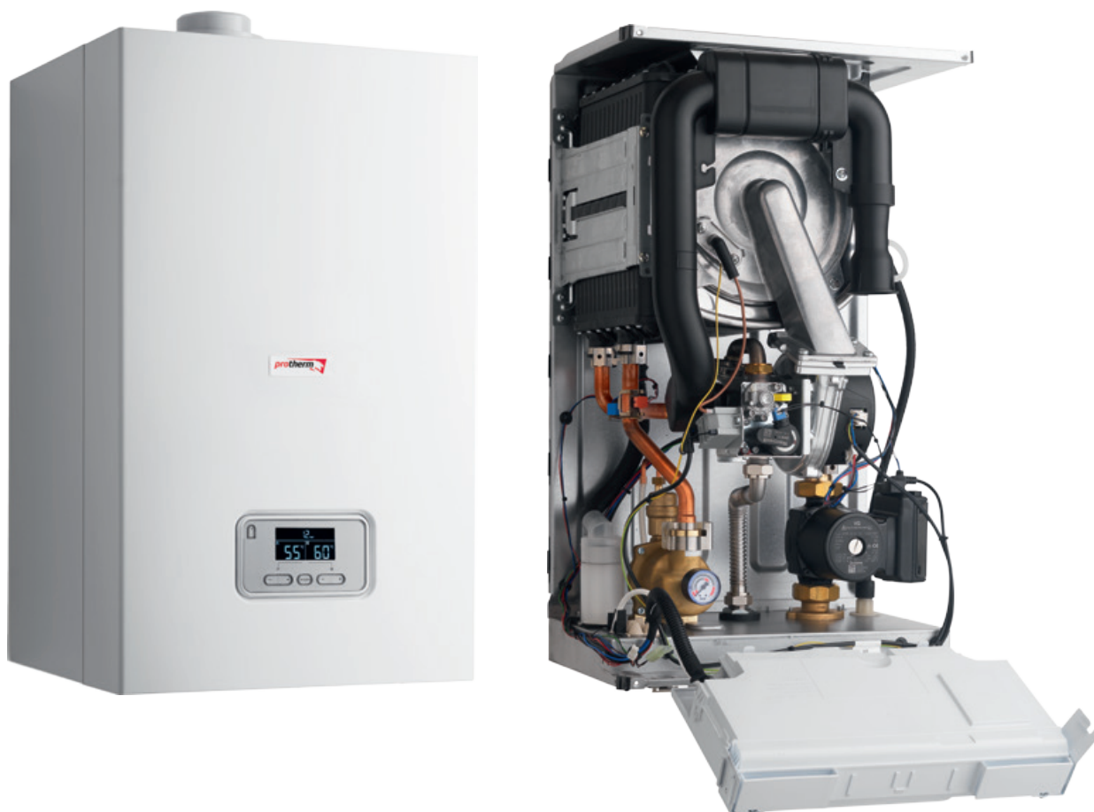
Konstrukce kondenzačního kotle Protherm Panther Condens 48 KKO