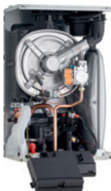
Puma Condens 18/24 MKV-AS/1