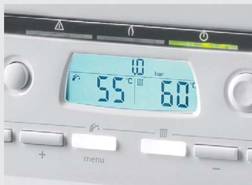
Přehledný ovládací panel pro snadnou obsluhu s velkým podsvíceným displejem