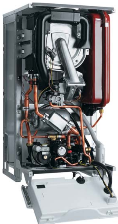
Nová konstrukce kondenzačního kotle s vestavěným zásobníkem Protherm Tiger Condens

Využijte širokou nabídku originálního příslušenství značky Protherm.